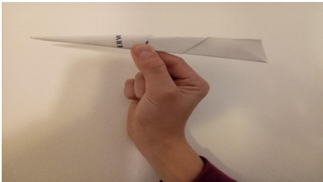
Slika 1: Prijem letala s prsti za težiščem.

Glede na to, da imamo improviziran pouk preko spleta, boste ponovili met čez ramo z metom papirnatega letala, ki ga sami izdelate doma. V principu, je met papirnatega letala enak metu vorteksa. Razlika je le v načinu prijema. Letalo primemo z dvema prstoma, kazalcem in palcem ( slika 1 ), vorteks pa primemo s celo dlanjo.